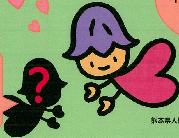
熊本県人権啓発キャラクター 「ココロ」