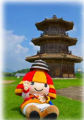
鞠智城 イメージキャラクター ころう君

第2・第4水曜日は ころう君の 鞠智城での巡回日！ 土日もたま～に 巡回しています！