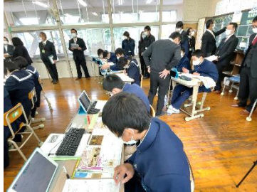
山鹿市立鹿北中学校 (社会科の実践)