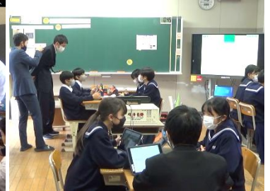
小国町立小国中学校 (数学科の実践)