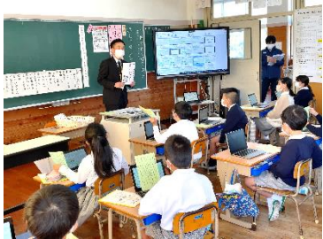
菊池市立菊池北小学校 (国語科の実践)

県下12市町村を拠点地域として指定し、ICTを活用した教育実践の普及・啓発を行ってきた「くまもとGIGAスクールプロジェクト」の中心校で授業公開が行われています。1人1台の学習用端末の活用を中心とした様々な授業が提案され、多くの先生方の学びの場となっています。「まずは使ってみる」からスタートした取り組みですが、全ての学校で子供たちの将来を見据えた学びが展開されるようこれからも支援してきます。