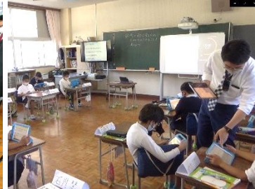
益城町立津森小学校 (社会科の実践)