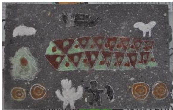
石版に描いた装飾古墳文様 (古代絵画教室参加者の作品)