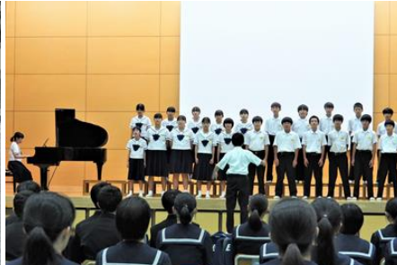
1年生：チームワーク賞