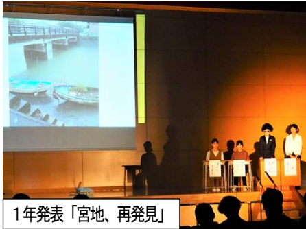
1年発表「宮地、再発見」