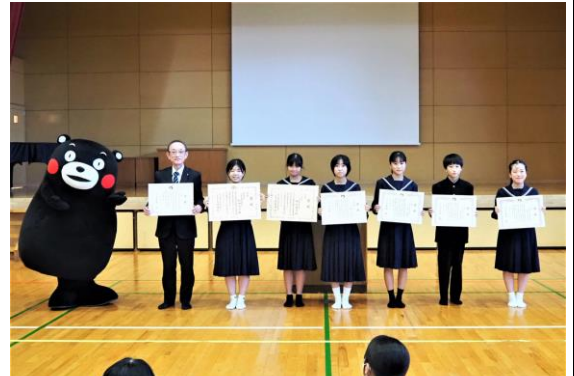
表彰後のくまモンとの記念撮影