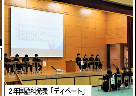
2年国語科発表「ディベート」