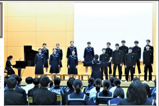
最優秀賞の3年生合唱「絆」

文化祭の午後、校内合唱コンクールを行いました。これまで各学級ともに朝、昼休み、放課後と最優秀賞を目指して、心を一つにして練習を重ねてきました。どの学級も素晴らしい歌声とハーモニーでした。最優秀賞は3年生が選ばれました。3年生の発表はさすが最上級生と思える、素晴らしいものでした。各学年ともに、これまで頑張ってきた成果を今後の学校生活につなげてほしいと思います。