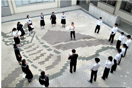
3年生の昼休み練習風景