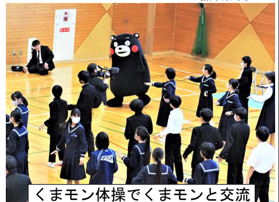
くまモン体操でくまモンと交流