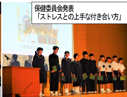
保健委員会発表 「ストレスとの上手な付き合い方」