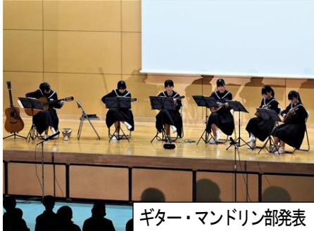
ギター・マンドリン部発表