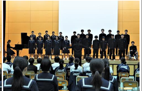
2年生：エクスペッション賞