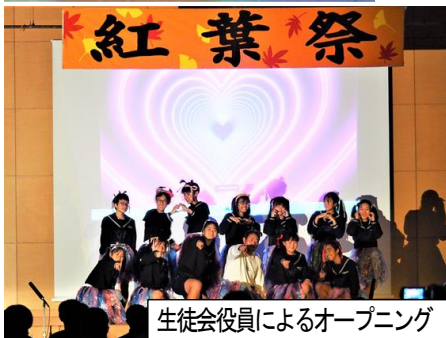
生徒会役員によるオープニング

11月1日、紅葉祭を実施しました。昨年同様、午前中半日という日程で行いました。体育大会が終わって約1ヶ月の短い準備期間でしたが、それぞれの学年、総合的な学習の時間等でこれまで学習してきたことをステージ、展示で発表しました。また、教科、委員会、部活動からの発表もありました。生徒会執行部によるオープニングの後、開会行事を行い、保健委員会による発表からスタートしました。どの発表もこれまで学習したり、練習したりしてきたことをしっかりとまとめ、工夫を凝らした素晴らしい発表でした。