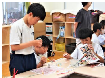
フィールドワーク「共生:とら太の会」