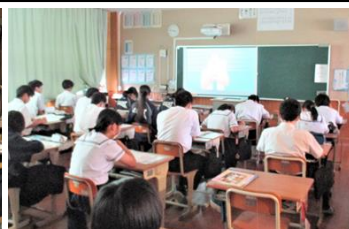
1・2年生もリモートで参加