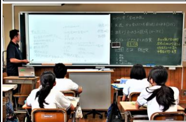
小中合同でまとめ作業