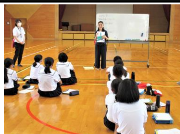
オリエンテーション「みやじ和紙」