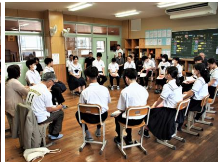
3年生『美子のたたかい』