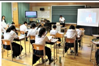
真剣に説明を聞く3年生

7月12日、校内高等学校等説明会を行いました。3年生は夏休みに三者面談が実施され、これからいよいよ進路選択の時期に入っていきます。自分の進路を選択する際に最も大切なことは様々な情報を正しく知っておくことです。当日は、近隣の高等学校等12校から来校いただき説明をしていただきました。本年度より1、2年生も参加し、説明を聞きました。自らの「夢」実現に向けて、たくさんの情報を知り、自らの「夢」を育む参考にしてほしいと思います。生徒の皆さんは真剣に高校からの説明を聞いていました。