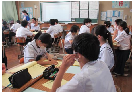
2年生『今言わなければ』