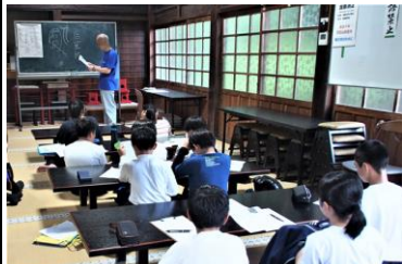
フィールドワーク「宗覚寺」

宮地小学校と第八中学校では「自分の生まれ育ったふるさと『みやじ』の『歴史』『人権』『自然』をテーマに、体験学習等を通してこれまで受け継がれてきた生活文化や人々の豊かな心を引き継ぎ、ふるさとを誇りに思う郷土愛を育むこと」を目的に総合的な学習の時間で『みやじ学』に取り組んでいます。この活動は小中連携教育の一環として、小学5年から中学1年までの縦割り班で学習します。6月21日にオリエンテーション、27日にフィールドワークを行いました。27日はあいにくの雨でしたが、それぞれの活動場所で小学生と一緒に学習を行いました。学習したことはまとめを行い、7月18日に発表会を実施しました。発表した6つのグループすべて、素晴らしい発表を行いました。