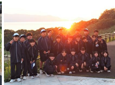
【天草に沈む夕日をバックに】