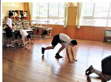
【無言清掃で頑張っています】

おいしい給食、昼休みのあとは掃除の時間です。生徒の皆さんは無言清掃で時間いっぱい、頑張って掃除を行います。そして午後の授業と続きます。以上のように、生徒の皆さんは毎日、落ち着いた雰囲気の中、充実した学校生活を頑張っています。