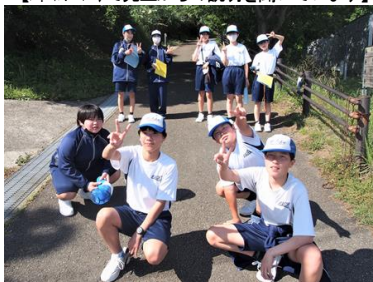
【ビンゴオリエンテーリング】