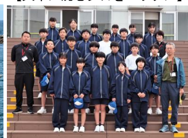
【みんなで記念撮影】