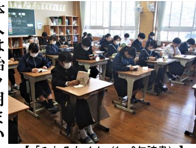
【「みむろタイム（1・2年読書）」】