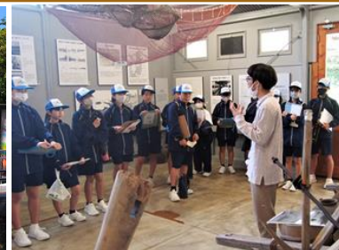
【水俣病歴史考証館にて】