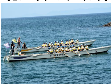
【マリン活動（カッター船）】