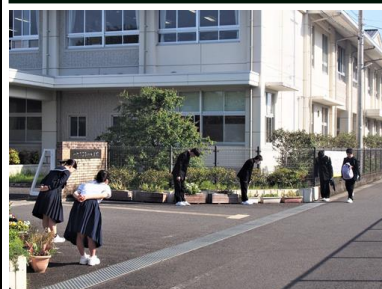
【朝のボランティア活動（挨拶運動）】

八中の学校生活の様子を紹介します。まず、ボランティア活動で行っている挨拶運動から始まります。数名の皆さんがさわやかな挨拶で登校する皆さんを迎えます。8時15分からの「みむろタイム」で学校生活がスタート。3年生は受験に向けたセミナー学習、1・2年生は朝読書を行います。静かな中で落ち着いた学校生活の始まりです。八中ではチャイムはなりません。一人一人が時計を見て主体的に行動します。しかし、時間に遅れる人はいません。授業開始。授業の始まりには気持ちを落ち着けるために、黙想から始まります。授業では電子黒板やタブレットPCなどのICT機器を効果的に活用して学習します。