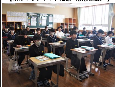
【授業開始（黙想から始まります）】