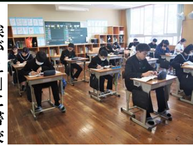
【「みむろタイム（3年セミナー学習）」】

八中の学校生活の様子を紹介します。まず、ボランティア活動で行っている挨拶運動から始まります。数名の皆さんがさわやかな挨拶で登校する皆さんを迎えます。8時15分からの「みむろタイム」で学校生活がスタート。3年生は受験に向けたセミナー学習、1・2年生は朝読書を行います。静かな中で落ち着いた学校生活の始まりです。八中ではチャイムはなりません。一人一人が時計を見て主体的に行動します。しかし、時間に遅れる人はいません。授業開始。授業の始まりには気持ちを落ち着けるために、黙想から始まります。授業では電子黒板やタブレットPCなどのICT機器を効果的に活用して学習します。