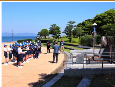
【フィールドワークで先生からの説明を聞いています】

2日間という短い期間でしたが、たくさんの大きな学びがあったと思います。また、1年生の成長を感じることができた2日間でした。集団宿泊教室で学んだことを、これからの学校生活に生かしてほしいと思います。