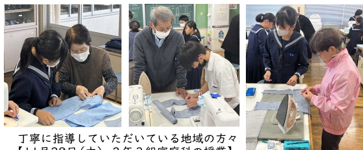
丁寧に指導していただいている地域の方々 【11月28日(木) 2年3組家庭科の授業】

四中では、家庭科の裁縫や調理、習字、水泳の授業で地域の方々のご協力をいただいています。これは、地域学校協働活動の一環で、梅田地域コーディネーターに人員の調整をお願いしているものです。