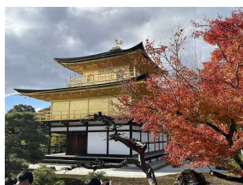
↑ 貴重な金閣と紅葉の組み合わせ 北野天満宮「御土居もみじ苑」→