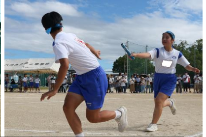
どのクラスも全力でバトンをつないだ全員リレー