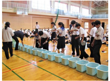
資源ゴミの分別体験

1年生は総合的な学習の時間に環境をテーマとして学習しています。7月6日、1年生は環境教育講演会を行いました。八代市循環社会推進課から2名の講師の方をお招きして、お話をさせていただきました。最初に代表の生徒の皆さんが実際に資源ゴミの分別体験を行いました。その後、正しいゴミの分別方法と資源の出し方について、説明していただきました。捨てればゴミですが活用すれば資源となります。正しい分別、回収方法を学び、日々の生活に生かし、ゴミの削減、資源の有効活用について考えて欲しいと思います。文書でもお知らせしていますが、8月20日には本校においても資源回収を行います。資源回収について、ご協力をお願いします。