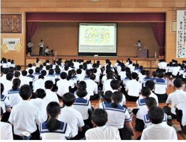
2年生有志による読み聞かせ

6月30日に人権同和教育講演会、学年・学級保護者会を行いました。保護者の皆様にはお忙しい中に来校いただきありがとうございました。人権同和教育講演会では、最初に2年生有志による読み聞かせ「いのちをいただく」を行いました。その後、