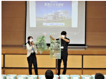
燃えるゴミの出し方の説明

1年生は総合的な学習の時間に環境をテーマとして学習しています。7月6日、1年生は環境教育講演会を行いました。八代市循環社会推進課から2名の講師の方をお招きして、お話をさせていただきました。最初に代表の生徒の皆さんが実際に資源ゴミの分別体験を行いました。その後、正しいゴミの分別方法と資源の出し方について、説明していただきました。捨てればゴミですが活用すれば資源となります。正しい分別、回収方法を学び、日々の生活に生かし、ゴミの削減、資源の有効活用について考えて欲しいと思います。文書でもお知らせしていますが、8月20日には本校においても資源回収を行います。資源回収について、ご協力をお願いします。