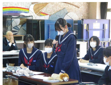
2年生人権集会のようす