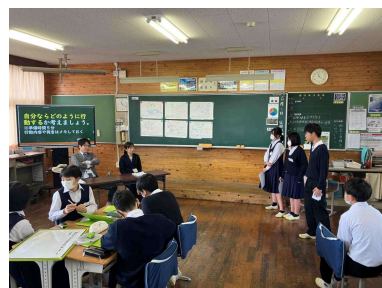
1年生人権学習のようす

保護者の皆様には、進路や人権学習をお家での話題にいただき、子供たちへの生き方の具体的なアドバイスをぜひお願いいたします。