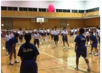
フラバールボールバレー