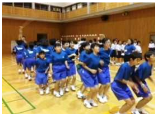
クラスマッチ(大縄跳び)