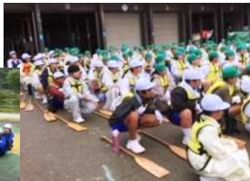
待ちに待ったマリン活動