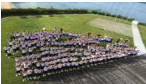
山鹿中学校の生徒と一緒に記念撮影