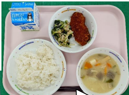
4月22日(水) 天草産ぶりをを使ったぶりフライ