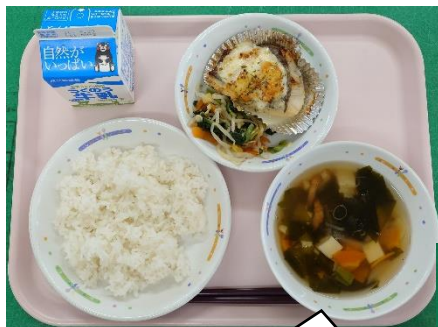
4月20日(火) 天草産春キャベツを使った春キャベツのスープ

昨年度に引き続き、今年度も毎月「天草宝島デー」を実施しています。毎月天草の美味しい食材を使った献立が登場します。今回は4月分の天草宝島デーの献立を紹介します。