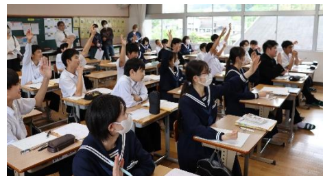
元気に手が挙がる2年生の授業