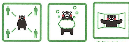
くっつかないモン #KeepDistance