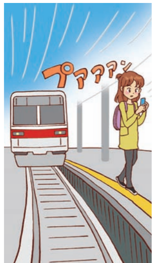
② 駅のホームからの転落で死亡事故も…。