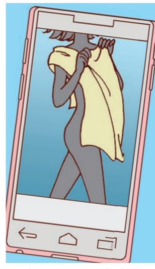
③ 露出しすぎた写真は、悪用されたり児童ポルノ禁止法などの罪に問われたりする場合もあるよ。