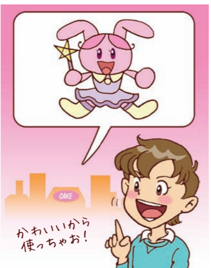
③ 無断で自分の好きなアニメやマンガなどのキャラクターを投稿すると著作権という権利を侵害することがあるよ。