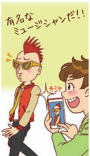
④ 勝手に人物を撮影すると人の権利を侵害することになるよ。