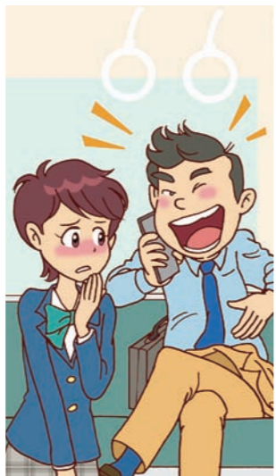
③ 電車やバスなど車内での通話は、迷惑&トラブルの原因に。