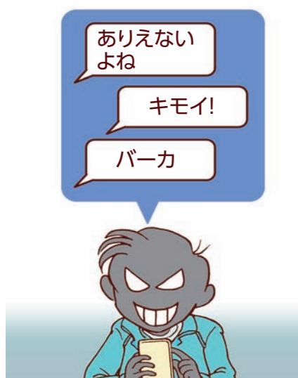
① 友だちの悪口や人を傷つける書き込みをしていないか、見直そう。 ※自分の名前を書いていない書き込みも特定されることがあります。