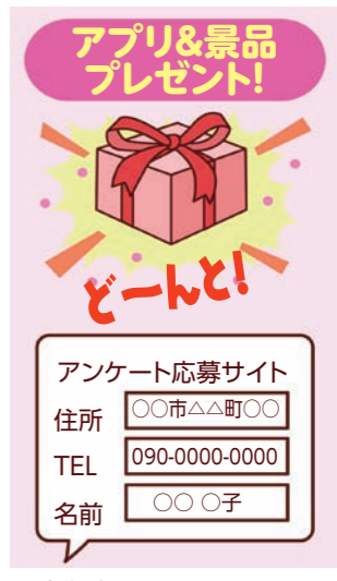
④ 無料プレゼント! といったオイシイサイトには要注意。