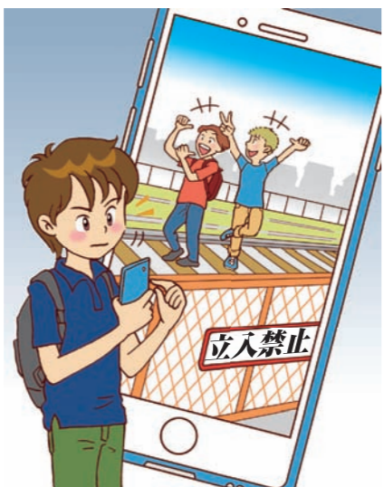
② いたずらしている姿を撮影し、勝手に写真を投稿してはいけません。