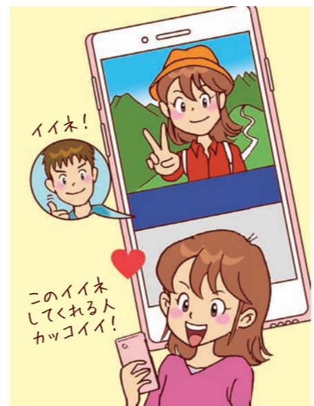
● SNSなどネット上で出会った人とのトラブルが増加しています。同じ趣味で話が合う、自分の話を聞いてくれるからといってその人を信用しすぎてはいけません!