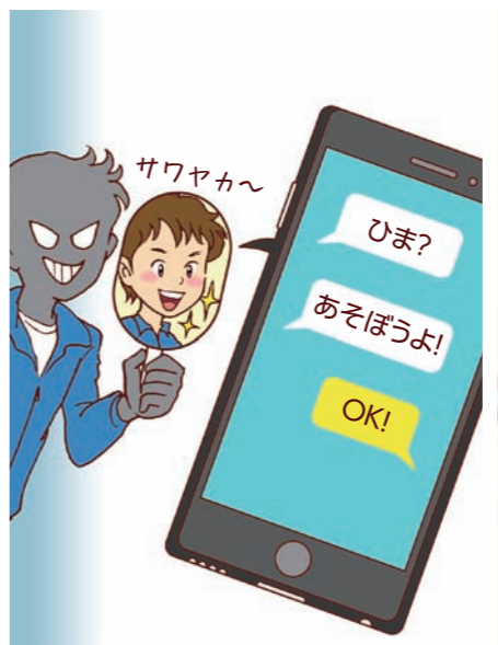
● 「自分だけは大丈夫」「信用できそうな人だから」との思いが大変なことに!