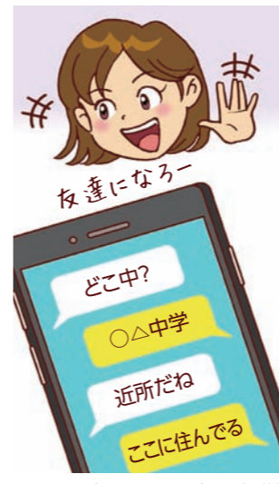
① よく知らない人に自分や友達の連絡先を教えると、悪用されることも。