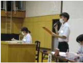
執行部による説明

次は実践です。みんなで決めた取組や生活心得を、一人一人が“自分たちの学校は、自分たちで創る”という意識で活動してくれることを期待します。