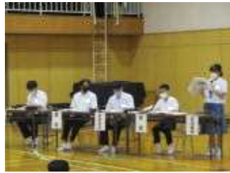
各専門委員長による説明