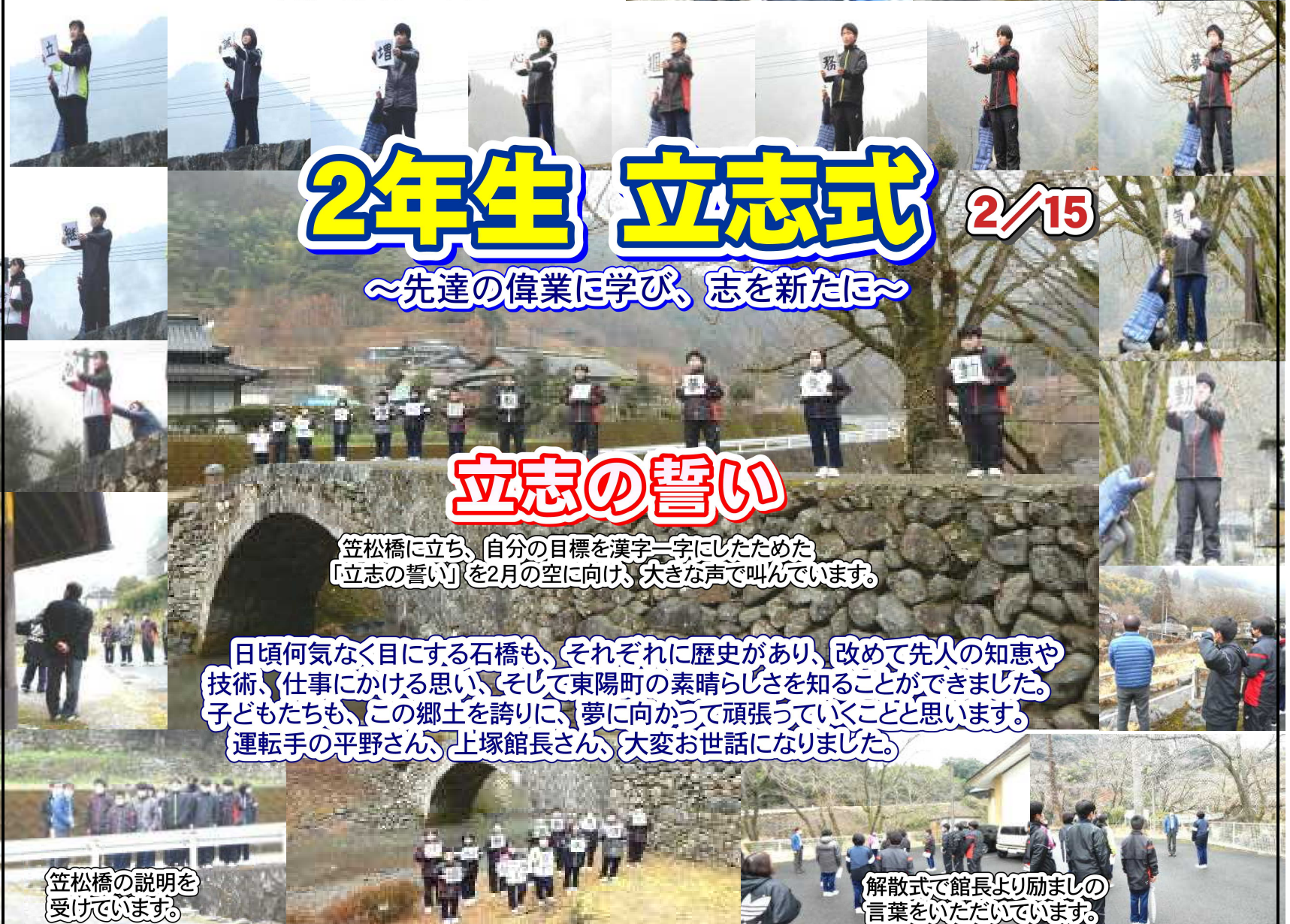
しおりの解説を見ながら、 実際の橋を見えています。