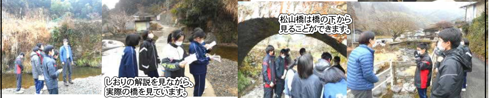
松山橋は橋の下から 見ることができます。

2回目となるリモートでの生徒集会です。今回は生徒会室をスタジオにバックパネルを準備して行われました。内容は委員会報告と次年度の生徒会テーマの提案などでした。