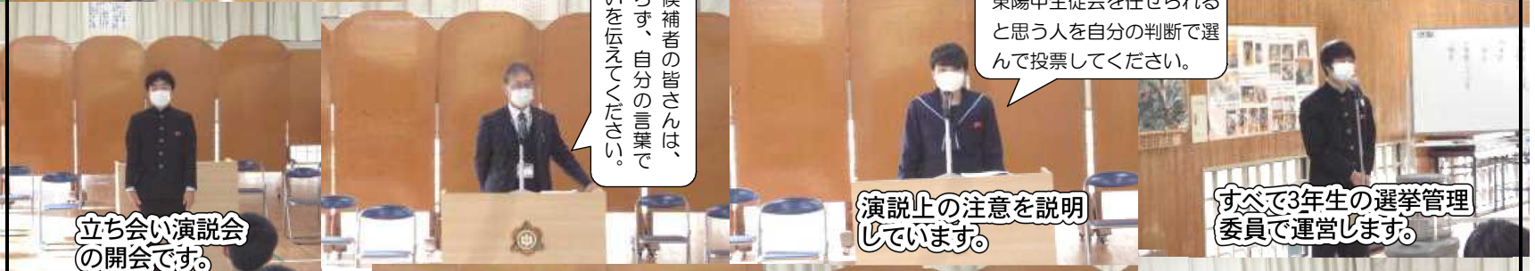
立ち会い演説会の開会です。