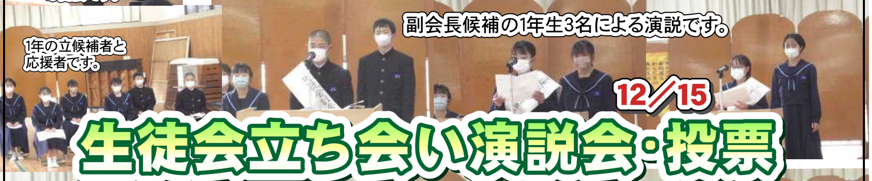
1年の立候補者と応援者です。