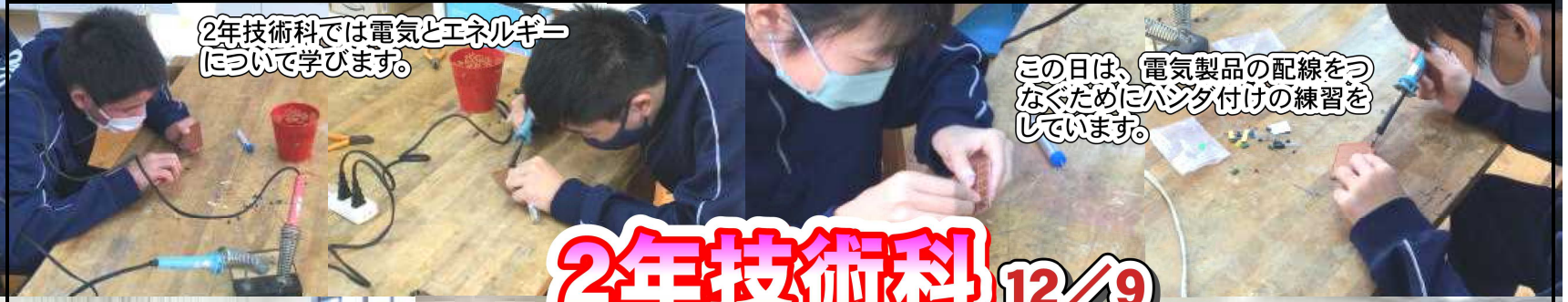
2年技術科では電気とエネルギーについて学びます。