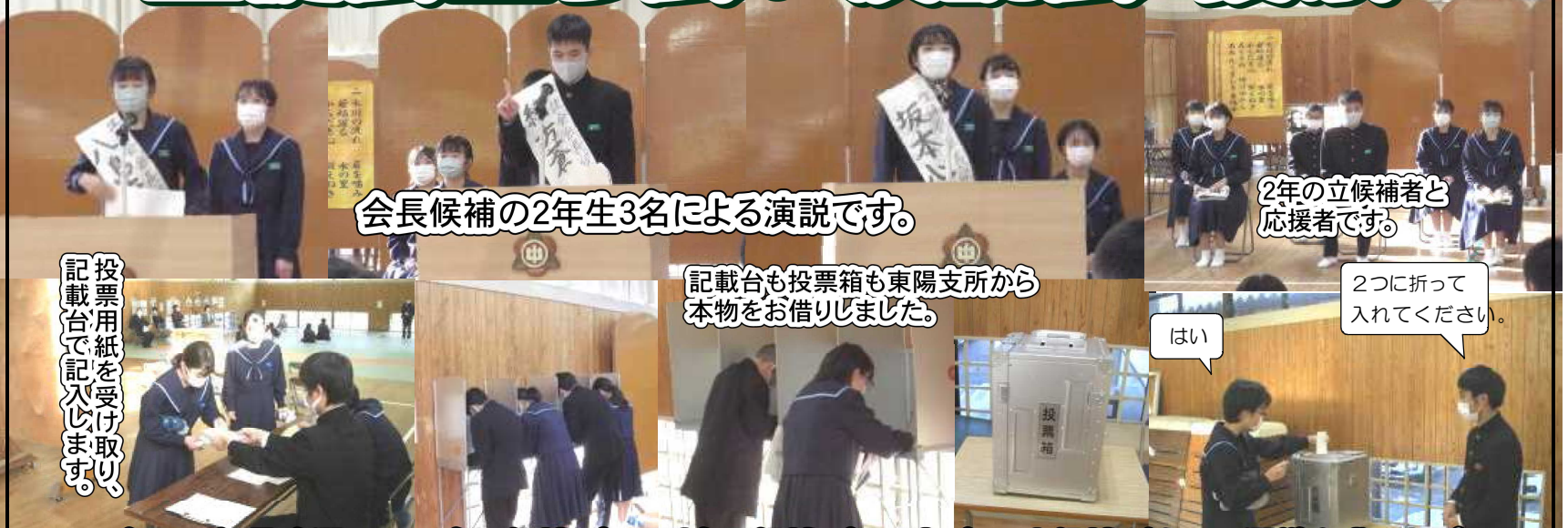
会長候補の2年生3名による演説です。