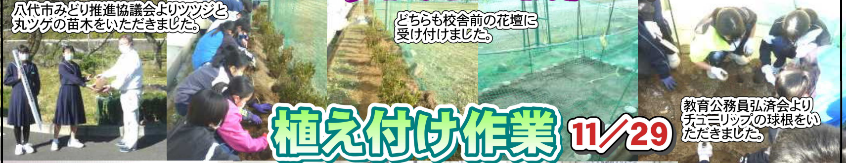
八代市みどり推進協議会よりツツジと丸ツゲの苗木をいただきました。