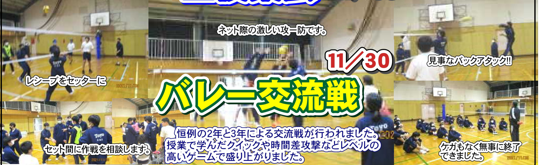
ネット際の激しい攻-防です。