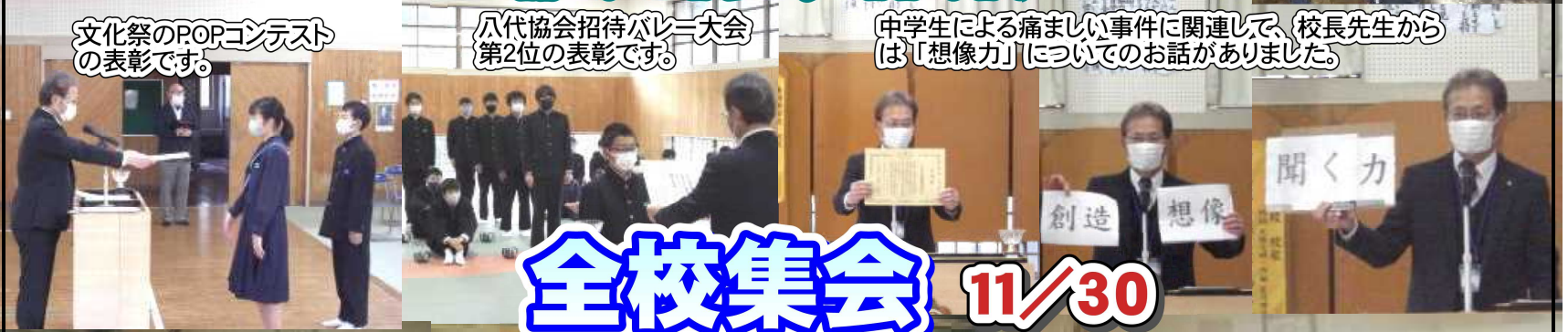
文化祭のPOPコンテストの表彰です。