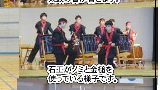
石匠が刀と金槌を使っている様子です。