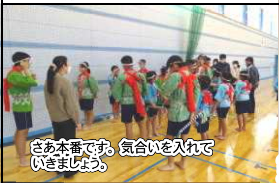
さあ本番です。気合いを入れていきましょう。