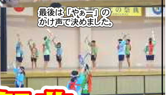
最後は「やあー」のかけ声で決めました。