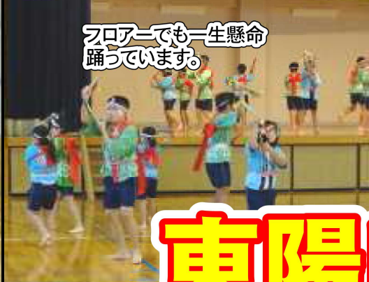
フローアでも一生懸命踊っています。