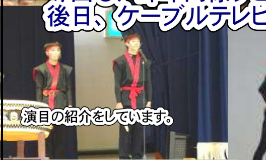
演目の紹介をしています。

今回も、昨年同様リモート開催となり、この日にビデオ撮影を行いました。後日、ケーブルテレビで放映されますので、ご家庭でじっくりご覧下さい。