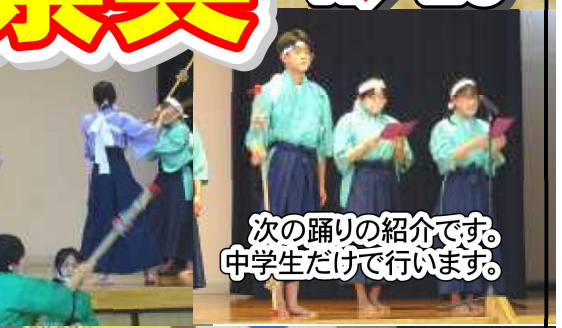
次の踊りの紹介です。中学生だけで行います。