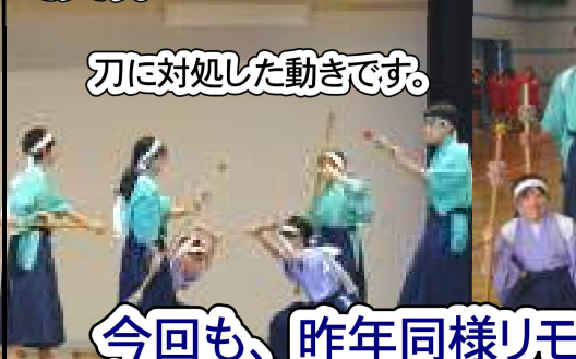
刀に対処した動きです。