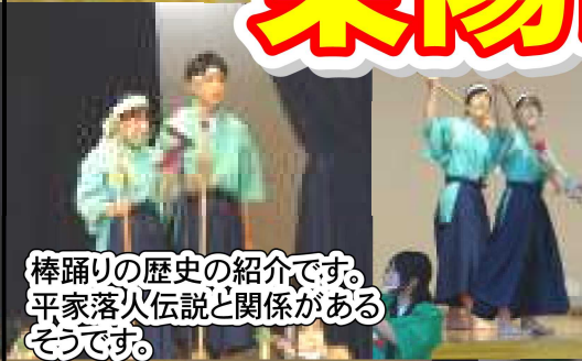
棒踊りの歴史の紹介です。平家落人伝説と関係があるそうです。