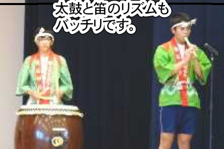
太鼓と笛のリズムもバッチリです。