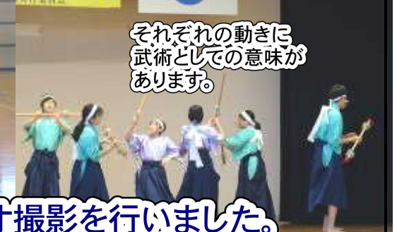
それぞれの動きに、武術としての意味があります。

今回も、昨年同様リモート開催となり、この日にビデオ撮影を行いました。後日、ケーブルテレビで放映されますので、ご家庭でじっくりご覧下さい。