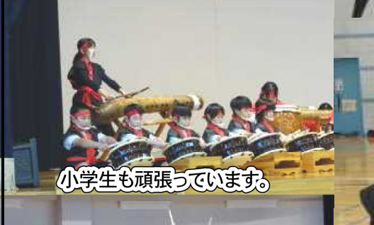
小学生も頑張っています。