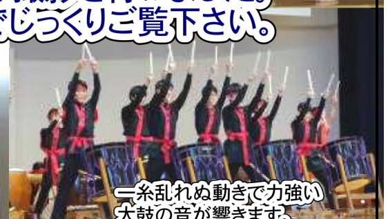
一糸乱れぬ動きで力強い太鼓の音が響きます。