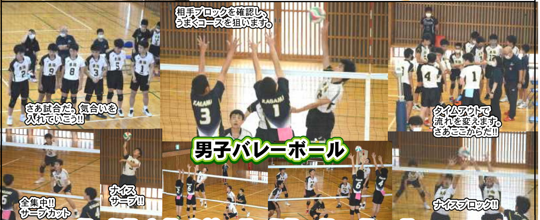
相手ブロックを確認し、うまくコースを狙います。