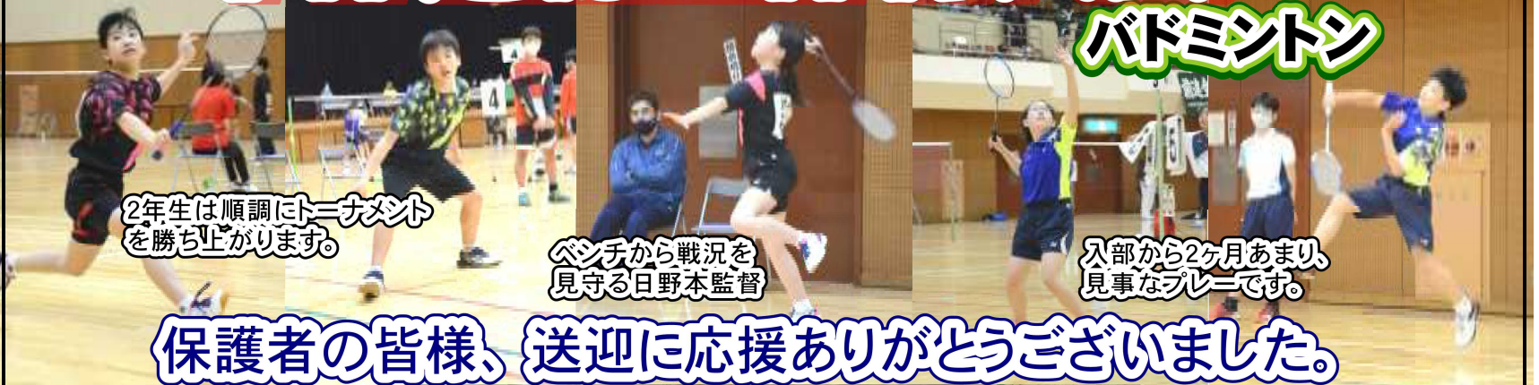
2年生は順調に3セットを勝ち上がります。