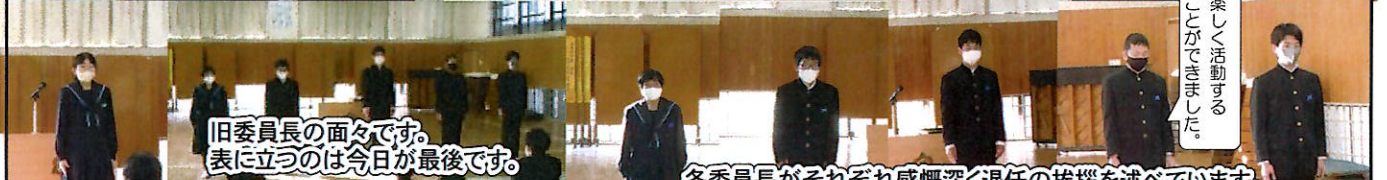
旧委員長の面々です。表に立つのは今日が最後です。