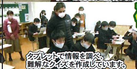
タブレットで情報を調べ、難解なクイズを作成しています。