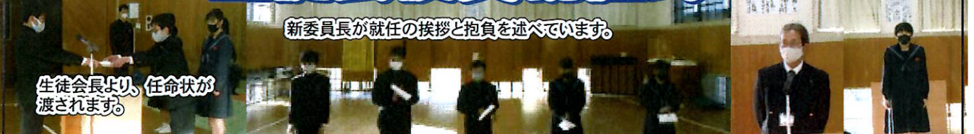
新委員長が就任の挨拶と抱負を述べています。