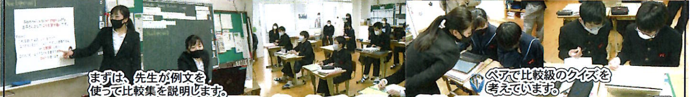
まずは、先生が例文を使って比較集を説明します。

年が明け、東陽中も生徒・職員ともに穏やかに新年を迎えることができました。今年も大変な年になりそうですが、「得意淡然」「失意泰然」で、その時その時にやるべきことをきちんとやって、この困難と向き合っていきましょう。