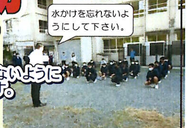
プランターにピオラと撫子を植えました。この花を枯らさないようにしっかり管理して、卒業式や入学式で会場を飾る予定です。