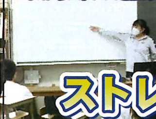
原先生にストレスマネジメントの授業をしていただきました。これからストレスと上手に付き合っていきたいと思います。