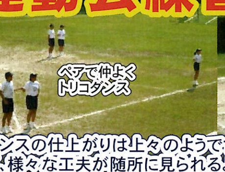
ペタで伸ばす DJダンス