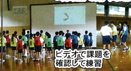
ビデオで課題を 確認して練習

紅白両団ともにダンスの仕上がりは上々のようです。隊形変化や時間差で動くなど、様々な工夫が随所に見られるようになりました。