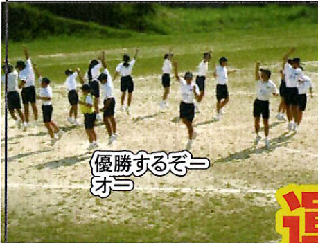
優勝するぞー オー