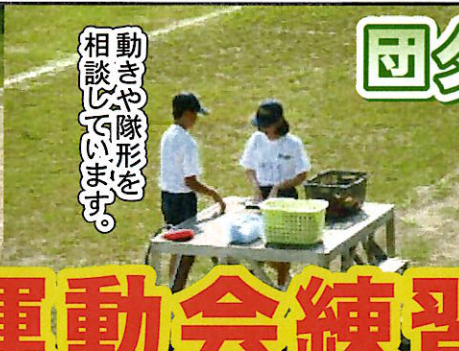
動きや隊形を 相談しています。