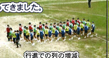
行進での列の増減