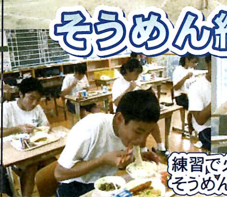
練習で火照った体に、 そうめんは最高です。