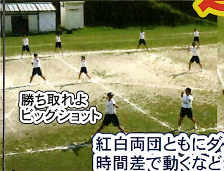
勝ち取れよ ピックショット