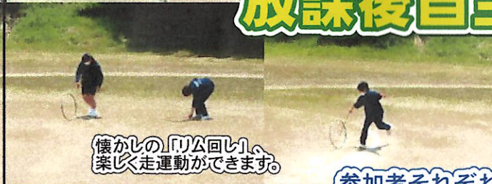
懐かしの「リム回し」、楽しく走運動ができます。