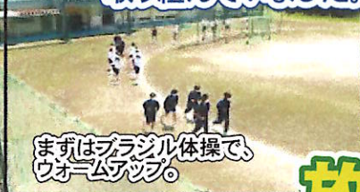
まずはブラジル体操でウォームアップ。

来る6月の学校再開に向け、今週より午前中3時間の授業と自由参加の運動を行っています。欠々の50分授業に少しくらいはありましたが、みんな集中して授業に取り組んでいました。徐々に日常を取り戻しつつあるようです。