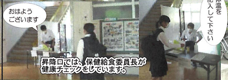
おはようございます