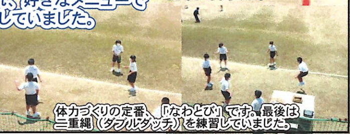
体力づくりの定番、「なわとび」です。最後は二重縄（ダブルタッチ）を練習していました。