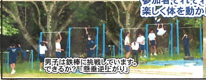
男子は鉄棒に挑戦しています。できるか？「懸垂逆上がり」