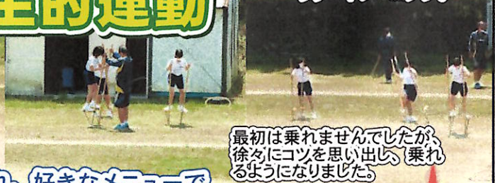
最初は乗れませんでした、徐々にコツを思い出し、乗れるようになりました。