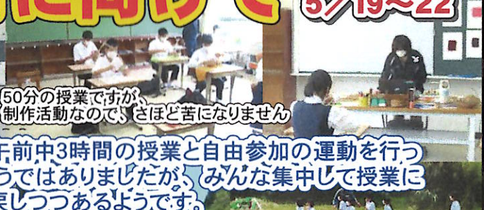
50分の授業ですが、制作活動なので、さほど苦になりません

来る6月の学校再開に向け、今週より午前中3時間の授業と自由参加の運動を行っています。欠々の50分授業に少しくらいはありましたが、みんな集中して授業に取り組んでいました。徐々に日常を取り戻しつつあるようです。