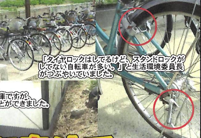
「タイヤロックはしてるけど、スタンドロックがしてない自転車が、多い。」と生活環境委員長がつぶやいていました。