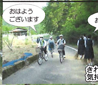
おはようございます