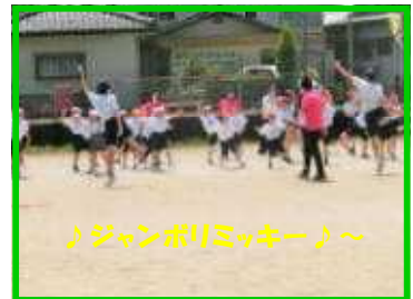
♪ジャンボリミッキー♪～