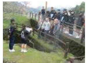
【英語でのボランティアガイド】

上記の質問に対しては、県、全国よりも高い肯定値になりました。「自律・協働・貢献」の学校教育目標スローガンを、子どもたちが意識して学校生活を送っていることを大変嬉しく思ひます。