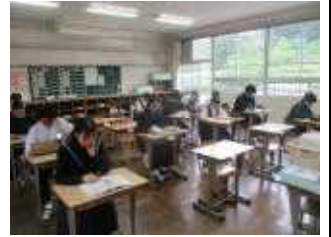
【全国学力・学習状況調査】

4月18日（木）・19日（金）に実施しました全国学力・学習状況調査（3年国語・数学）の結果についてお知らせします。※八代市学力・学習状況調査の結果は、東陽の旋風 No12・No14 でお知らせしています。