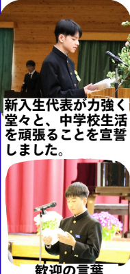
新入生代表が力強く活躍の場と、中々頑張りました。

次に「夢を描き」とは、自分の将来につながる進路を決定することです。そのために、中学校生活三年間でいろいろなことに挑戦し、自分の可能性を広げ