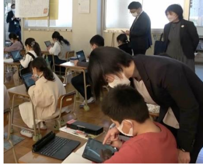
南関町立南関第二小学校（算数科の実践）