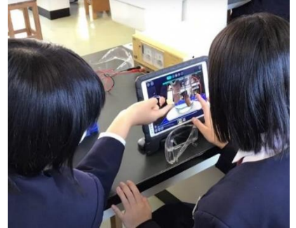
芦北町立田浦中学校（理科の実践）