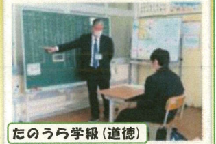
たのうら学級(道徳)