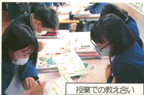
授業での教え合い