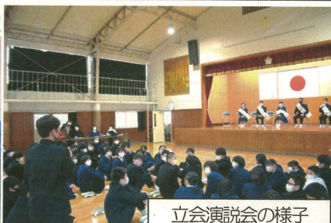
立会演説会の様子