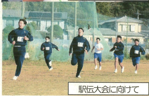
駅伝大会に向けて