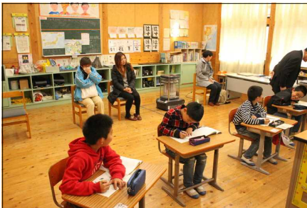
【授業参観の様子（4年生）】

いよいよ冬休みに入りますが、ご家庭でよいお正月をお迎えください。そして、来年も皆様にとりましてすばらしい年となりますよう、心よりご祈念申し上げます。