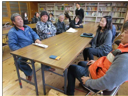
【ブロック懇談会の様子】