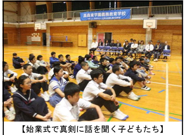
【始業式で真剣に話を聞く子どもたち】

スタートにあたり、1学期末の終業式で校長先生から話のあったことをもう一度思い出してみましょう。