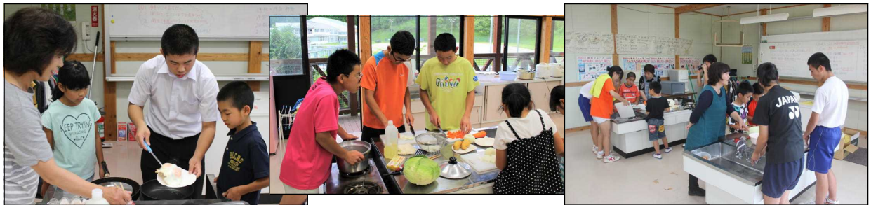
【通学合宿で、みんなで協力しながら、手際よく食事の準備をする児童生徒ら】

スタッフや講師として御協力いただきました保護者や地域の皆様、食材を御提供いただいた皆様、先生方、大変お世話になりました。引き続き、8月下旬のMブロックの通学合宿もよろしくお願いいたします。