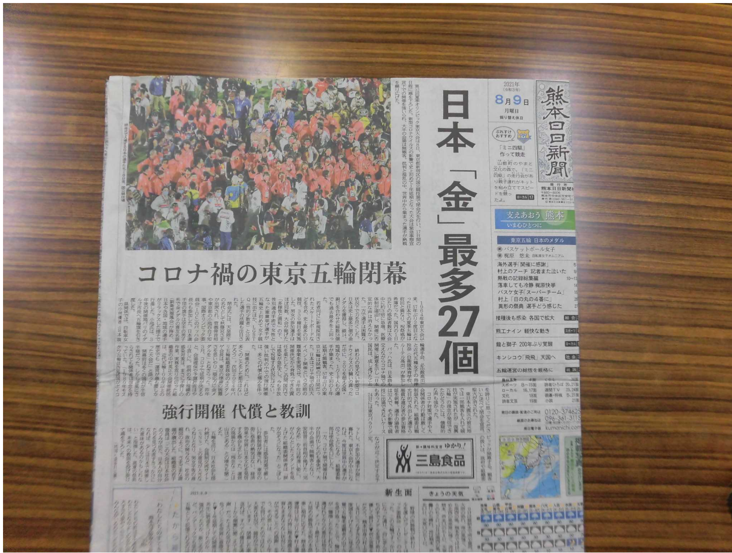
見せたい図柄が見えるようにたたむ(つなぎ目はどこになってもよい)