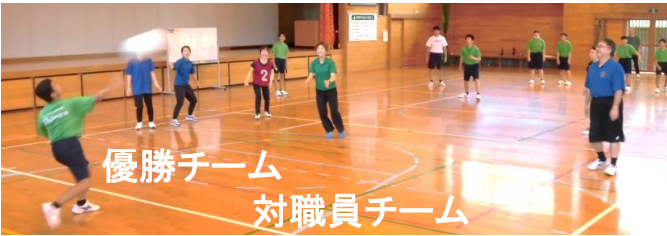
優勝チーム 対職員チーム

7月18日(木)に、生徒間の交流を深めることや体力アップ・運動習慣づくりを目的に、第1回生徒会主催ドッジボール大会を実施しました。暑い中、適時休憩をとり、熱中症に気をつけながら、熱い戦いをくり広げていました。優勝チームは職員チームと対戦しましたが、優勝チームの圧勝でした。生徒会の企画運営は、とてもよかったです。