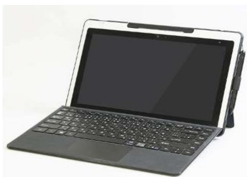
【必ず持ち帰る物】 タブレットパソコン本体（ペンあり）

※感染症及び災害等による緊急時においても円滑に活用できるように、通常時から子供たちの持ち帰りを想定しています。