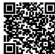
連絡メール2 保護者登録