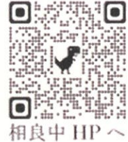
相良中 HP へ

記述回答の部分も含めて、今回の結果をもとにしながら、集会で生徒に話したり、学校通信等で紹介したりしながら、今後の学校運営や指導に生かしていきます。