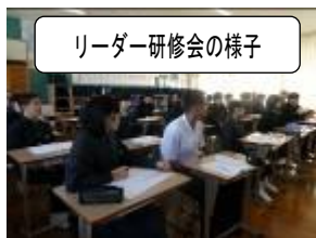
リーダー研修会の様子