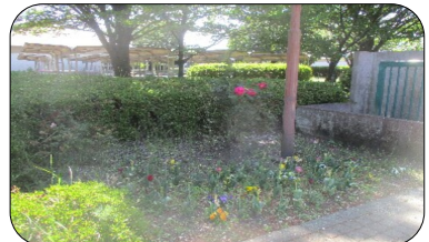
正門付近のきれいなバラです