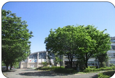
新緑があざやかです

さて、休校中の学校の様子をお伝えしたいと思っております。生徒の皆さんの声は響いていませんが、体育館周辺、新館周辺では鳥の鳴き声が響いています。鳥たちは、誰にも邪魔されず幸せそうに過ごしております。