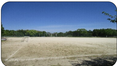
みんなを待っている運動場