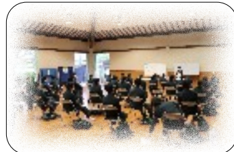
多目的ホールの様子