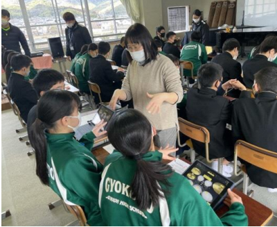
玉東町立玉東中学校（音楽科の実践）

今後も子供たちの学びの充実につながるICT活用を目指し、子供たちや先生たち、学校を応援していきます。