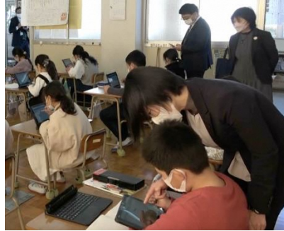
南関町立南関第二小学校（算数科の実践）