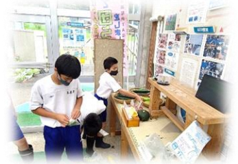
【高森町立高森東学園義務教育学校】