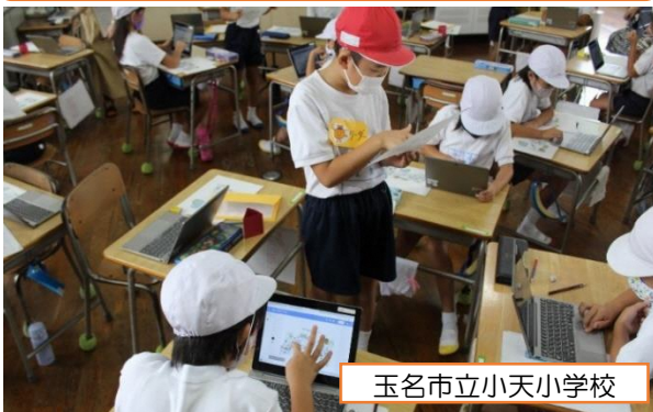
玉名市立小天小学校

単元のゴールを「1年生に、見学旅行で一緒に行く動物園の道案内をする」とすることで、子供たちの興味・関心を高めています。タブレットの利点を活かし、どのように道案内をするか色々な道順を試すなど、子供たちが主体的に学んでいます。（2年 国語）