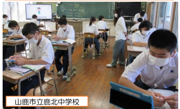
山鹿市立鹿北中学校

全体で文法の確認をした後、生徒の希望によって、基礎コースと発展コースに分かれます。基礎コースは先生のアドバイスを受けながら問題を解き、発展コースはタブレットのガイドを聞きながら問題を解いています。（3年 英語）