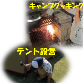
キャンプファイティング テント設営