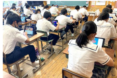
英語の企画書作りに取り組む様子（あさぎり町立あさぎり中学校・外国語科）