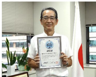
8月23日に本年度九州初の高等学校優良校に熊本西高等学校が認定されました。

子供たちの学びが大きく変わるということは、教師の指導方法も大きく変わることになります。従来型の一斉授業から、個人の実態に応じたきめ細やかな学びや、積極的に友達と一緒に課題を解決していく学びを行っていくことで子供たちの将来につながる確かな力を育てていきます。