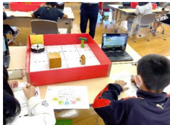
1人1台端末を活用したプログラミング学習の様子（美里町立砥用小学校）