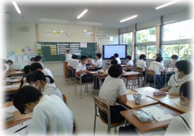
▲ 3-1 カミングアウトしてくれた友人にどう声をかけるか、意見交換の様子

一人一人が持っているセクシュアリティを構成する要素は4つあり、身体の性だけでなく心の性や好きになる性、表現する性などが組み合わせられて成り立っています。