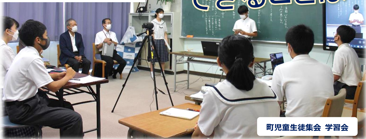
町児童生徒集会 学習会