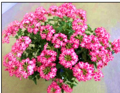
窓辺で鮮やかに咲くバーベナ

それぞれにリフレッシュした連休明けの運動場には、生徒の元気な声が1日中響いています。 体育大会 の練習です。朝から応援団。授業では、リレーや長縄の練習、そして、男女別の大中体操やソーランの練習。今回は、そんな、体育大会直前の様子の特集します。