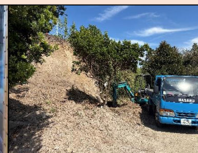
本校グラウンド東側の斜面崩壊。8/27, 28に土砂撤去↑