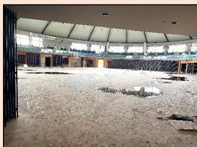
被害が大きかった松島・アロマの体育館。2日後の様子↑

9月1日は「防災の日」でもあります。始業式の中でも、生徒に下の写真のような今回の豪雨被害の様子を見せ、防災意識の大切さについて話をしました。各ご家庭でも、避難場所や集合場所、防災グッズや持ち出し品、地震・津波・大雨・台風などの災害ごとの避難の仕方の違いについて、確認したり話したりしてみてください。