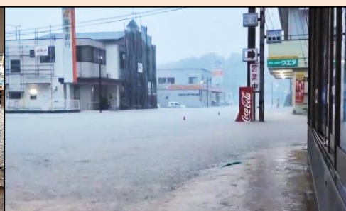
国道が川のように流れた大矢野庁舎入り口付近(植田自転車店から撮影)↑