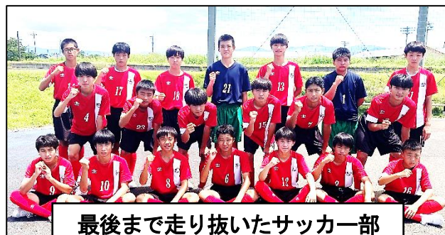
最後まで走り抜いたサッカー部

サッカー部 は、松島中学校との合同チームで、1回戦、力合中と対戦しました。暑い中でも声を出し、走り負けすることなく最後まで戦い抜きましたが、惜しくもコーナーキックからゴール前で押し込まれた1点に泣き、0対1で敗れました。松島中や上天草高校のサッカー部と練習し、天草の頂点に立ちました。お世話になりました。