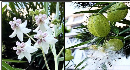
校門脇のフウセントウワタ （風船唐綿）の花・実・綿