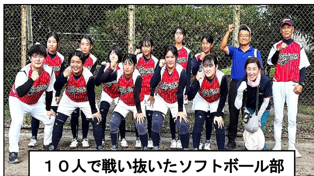
10人で戦い抜いたソフトボール部

女子ソフトボール部 は、二回戦で人吉二中と水上学園の合同チームと対戦しました。前半は互いに締まった試合で、一時は5対4と逆転しましたが、後半に大量失点し、6対16で敗退しました。3年生2人、全員でやっと10人というチームでしたが、単独校でチームを編成し、保護者、先生方、野球部に協力してもらい、ゲーム形式を経験し、本番に臨みました。これまでに一番いい試合ができました。ご協力、ありがとうございました。