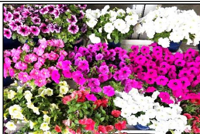
玄関のペチュニア

さて、連休が明けると、衣替えとともに体育大会の練習も本格的になります。暑さも加わりますので体調管理をしっかりしながら元気に5月の学校生活も充実させてほしいと思います。