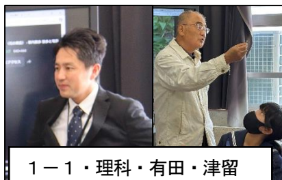
1-1・理科・有田・津留