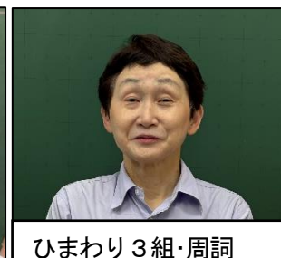
ひまわり3組・周詞