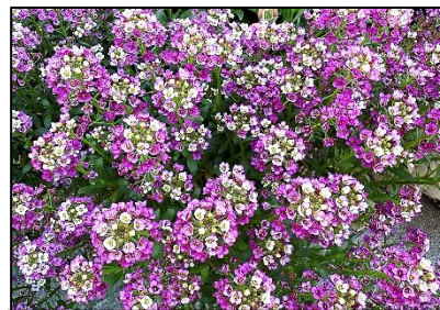
咲き誇る玄関のアリッサム