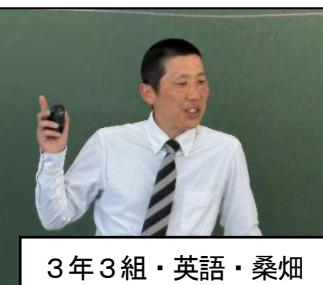
3年3組・英語・桑畑